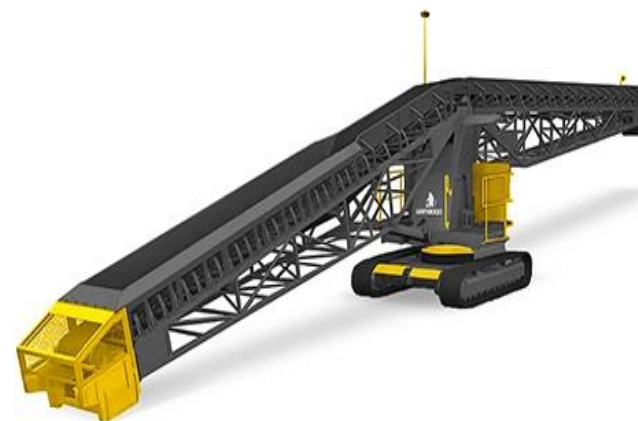
Ленточный транспортер ПЛМ 400