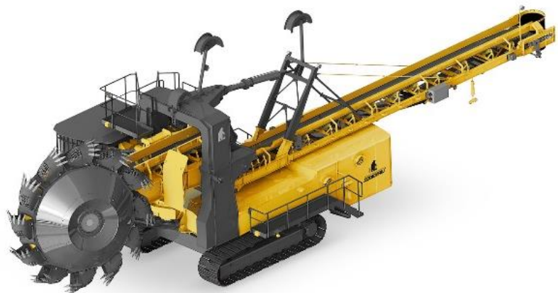
Роторный экскаватор КРЭ-400