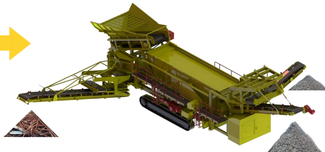
Установка мобильная сортировочная УМС-400